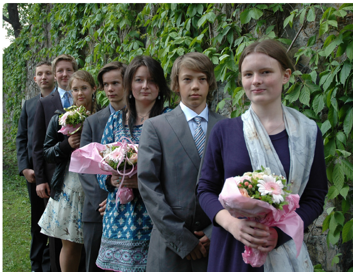
Молодые прихожане-«конфирманты» 2011 года в день торжественного поздравления 29 мая.

Крестный ход с водосвятным молебном в день памяти небесной покровительницы прихода святой равноапостольной княгини Ольги.